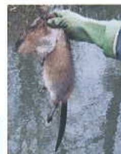
Se protéger avec des gants