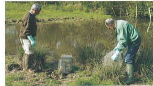
Une équipe de piégeurs avec leurs équipements de protection (gants et bottes)

La limitation du développement des rongeurs aquatiques en milieux rural participe à réduire fortement le risque de contamination.